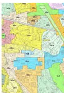
Document d'urbanisme de la commune : POS ou PLU