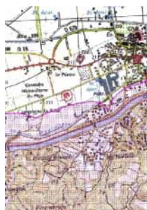
Carte délimitant les espaces soumis à la réglementation du débroussaillage, éditée par la préfecture

L'identification des administrés concernés s'effectue donc à partir de :