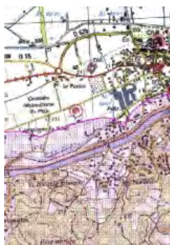
Carte délimitant les espaces soumis à la réglementation du débroussaillage, éditée par la Préfecture

L'identification des administrés concernés s'effectue à partir de :