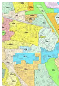
Document d'urbanisme de la commune : POS ou PLU